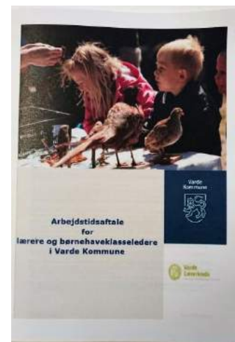
Arbejdstidsaftale for lærere og børnehaveklasselædere i Varde Kommune

Det bliver interessant at følge skolernes planlægning af næste skoleår. Målsætningen i lokalaftalen er klar, der skal være åbenhed